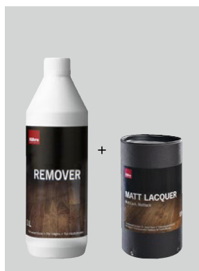
För mattlackade golv

Låt det gå minst 3 veckor innan du använder starka basiska rengöringsmedel.