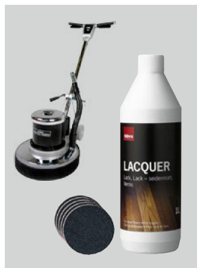
För lackade golv

Det finns tre metoder för överlackering: en för golv med lack, en för golv med mattlack och en